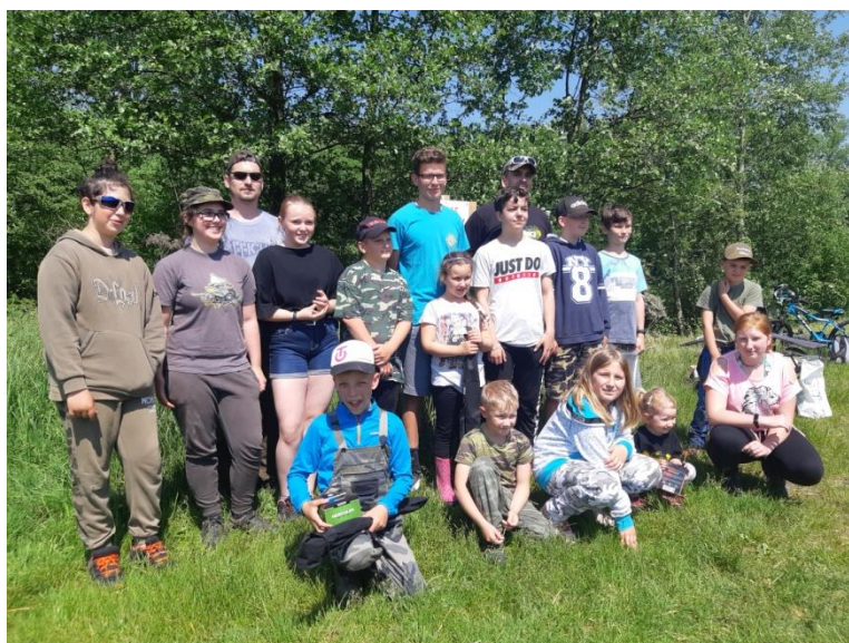
Obrázek 3 Účastníci závodu